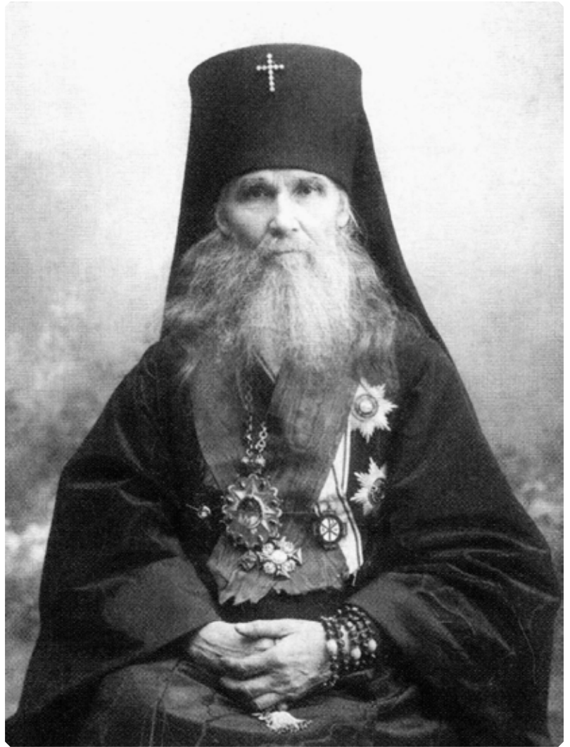
Высокопреосвященнейший Макарий (Невский), архиепископ Томский и Алтайский. Фото периода 1908–1912 гг. МАДМ

В парадном коридоре второго этажа архиерейского дома-музея – фотолетопись жизни святителя Макария, которого помнят тихие своды