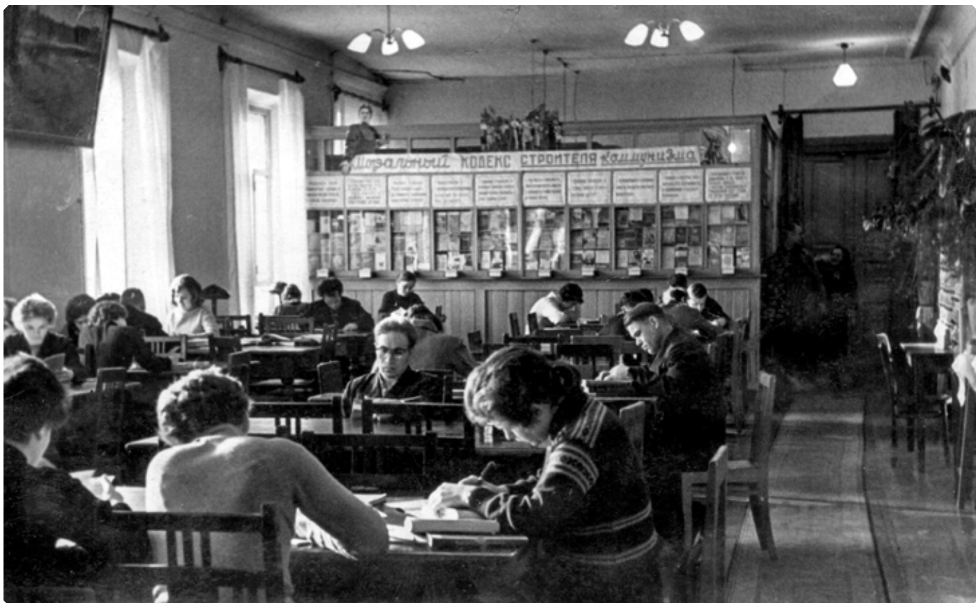
Вид читального зала Центральной городской библиотека со стороны входа в зал. Начало 1960-х гг. Центральная городская библиотека им. В.М. Шукшина