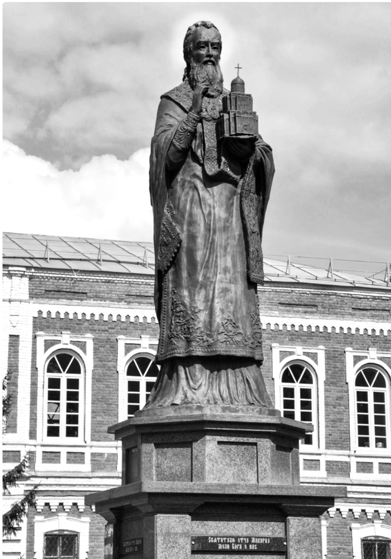
Памятник святителю Макарию (Невскому), митрополиту Алтайскому, на Бийском архиерейском подворье. 2020 г.