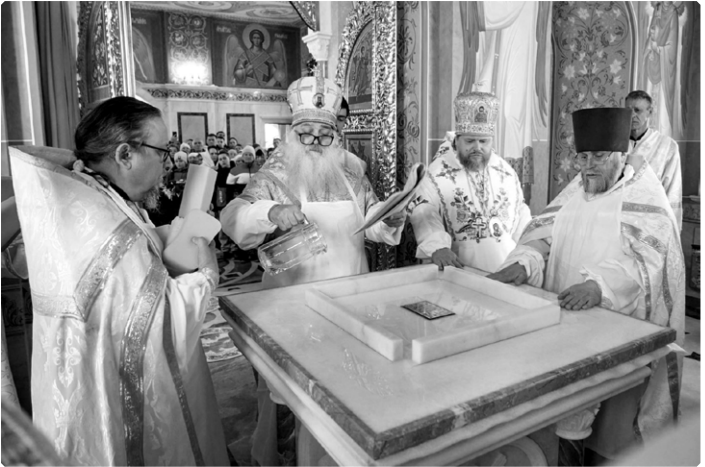
Омовение престола совершается в воспоминание о том, что Церковь освящена и омыта Кровию Господа нашего Иисуса Христа. Алтарь храма Покрова Пресвятой Богородицы. Село Алтайское. 4 апреля 2026 г.

проводиться торжественно, при участии собора епископов.