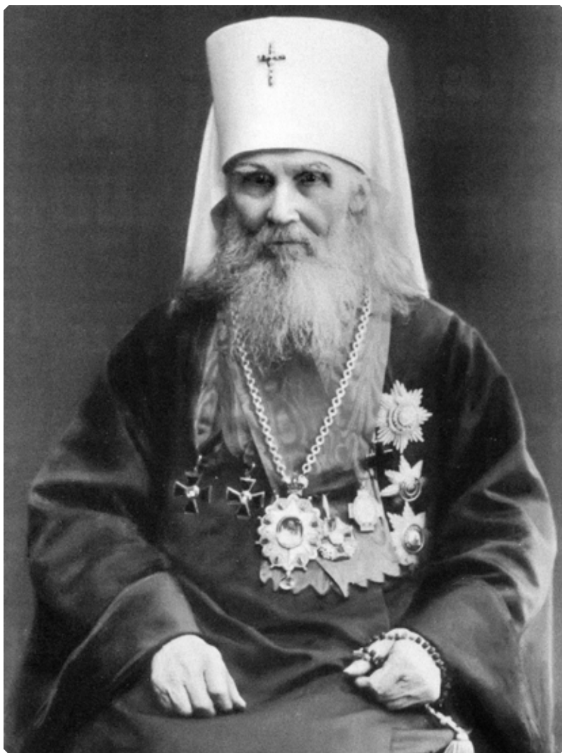
Высокопреосвященнейший Макарий (Невский), митрополит Московский и Коломенский. Фото периода 1912–1917 гг. МАДМ

Сегодня Бийское архиерейское подворье с Музеем истории Алтайской духовной миссии – популярное место познавательного и паломнического туризма. Тысячи людей ежегодно идут и едут сюда, чтобы лучше узнать историю православия на Алтае, укрепиться в вере, поклониться святыням, побывать в архиерейском доме, где жил молитвенник земли Русской святитель Макарий (Невский).