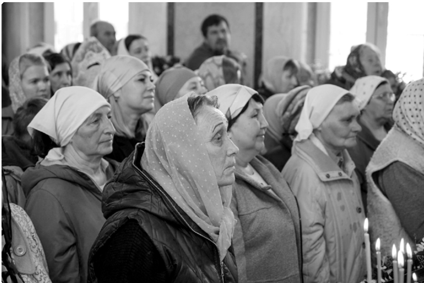
Прихожане Покровского храма на первой Божественной литургии. Село Алтайское. 4 апреля 2026 г.

ным, села Красноярского Покровской церкви священником Лаврентием Невским [1].