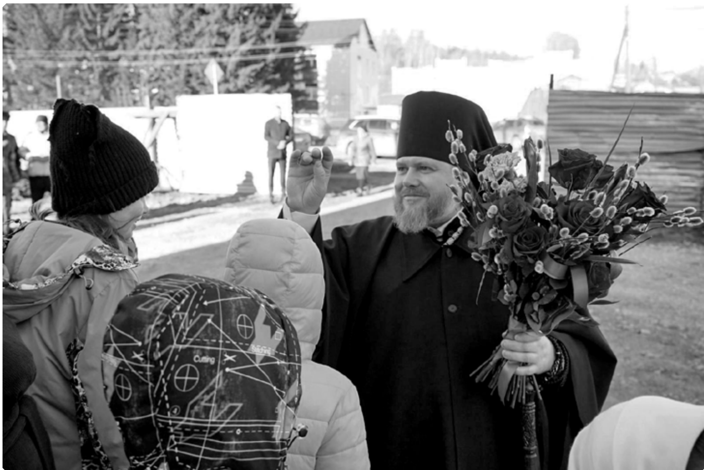
Прибывший для освящения Покровского храма Бийский архиерей благословляет детей. Село Алтайское. 4 апреля 2026 г.