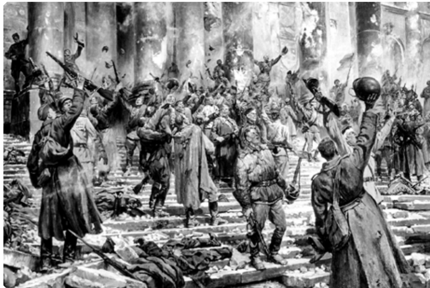
Победа. Пётр Кривоногов. 1948 г. Фрагмент

Пасха – праздник Исхода, праздник Освобождения и Победы. Знаменательным стало то, что Пасха 1945 года прилась на 6 мая (н. ст.), когда празднуется день великомученика Георгия Победоносца. Церковью святой воин прославляется как «пленных свободитель и нищих защититель, немощствующих врач, царей поборник». Имя «Георгий» с греческого значит «земледелец». И подобно святому великомученику Георгию миллионы мучеников-земледельцев, оторванных от родимой стороны, шагали вслед за солнцем, освобождая, за-