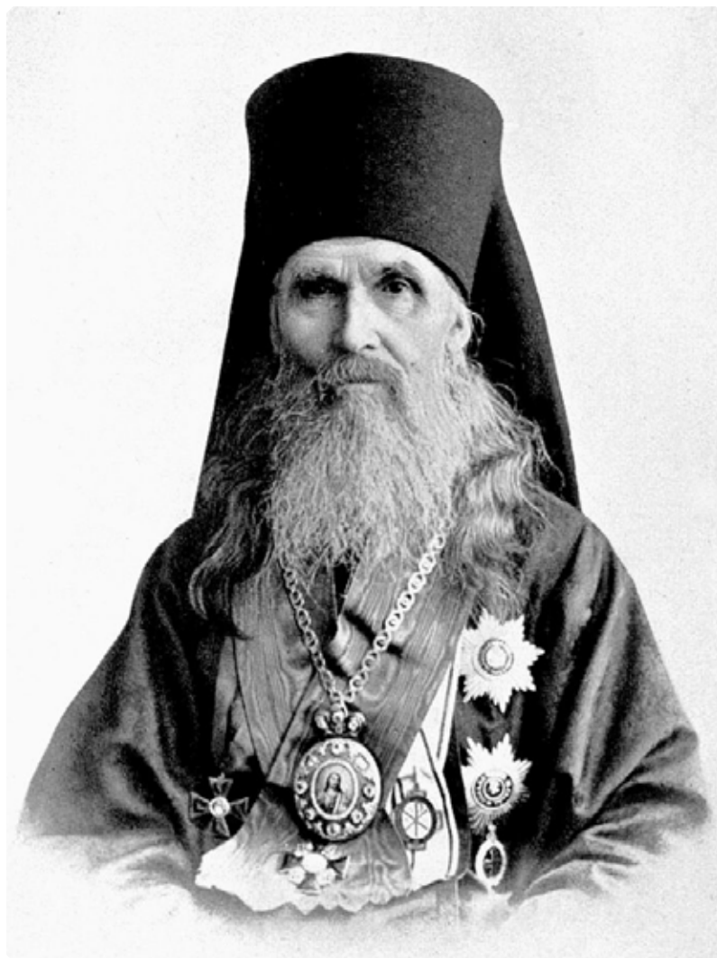
Преподобнейший Макарий (Невский), епископ Томский и Барнаульский. Начало XX в.

помнить завет Господа нашего Иисуса Христа о любви, выражающейся в смирении и послушании, которые так ценны в очах Божиих.